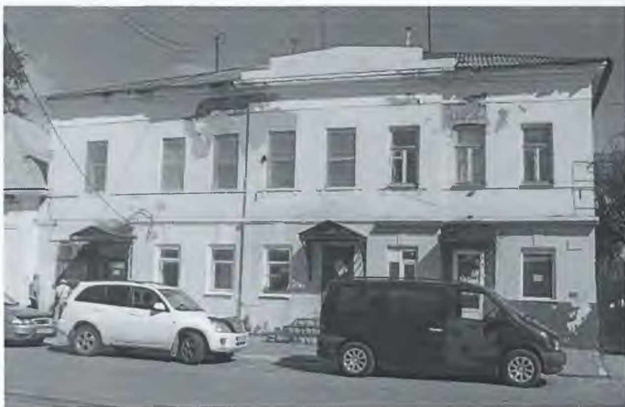
Фото 2. Главный западный фасад.