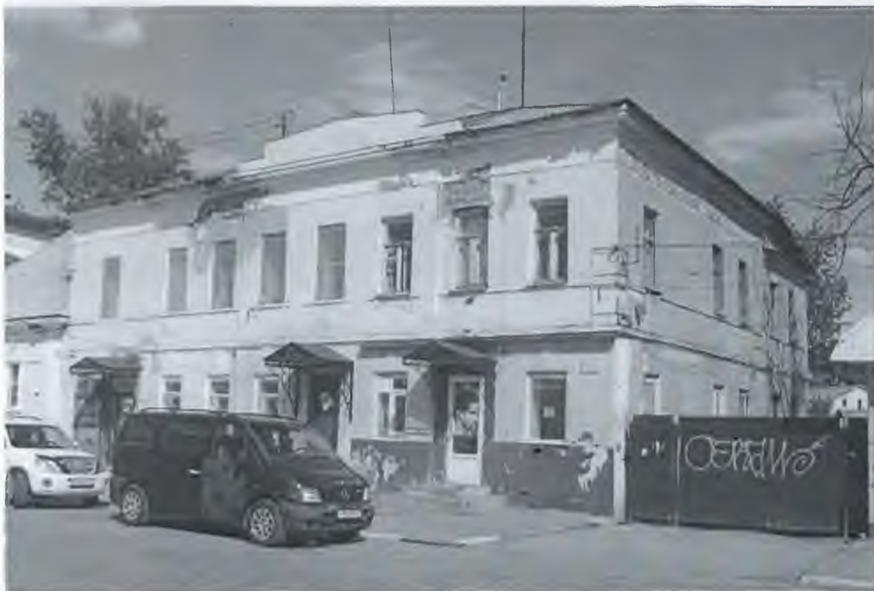
Фото 1. Вид с юго-запада.

«Доходный дом И.Ф. Духонина»,. Тульская область, город Тула, ул. Пирогова, д. 9, лит. А, А1