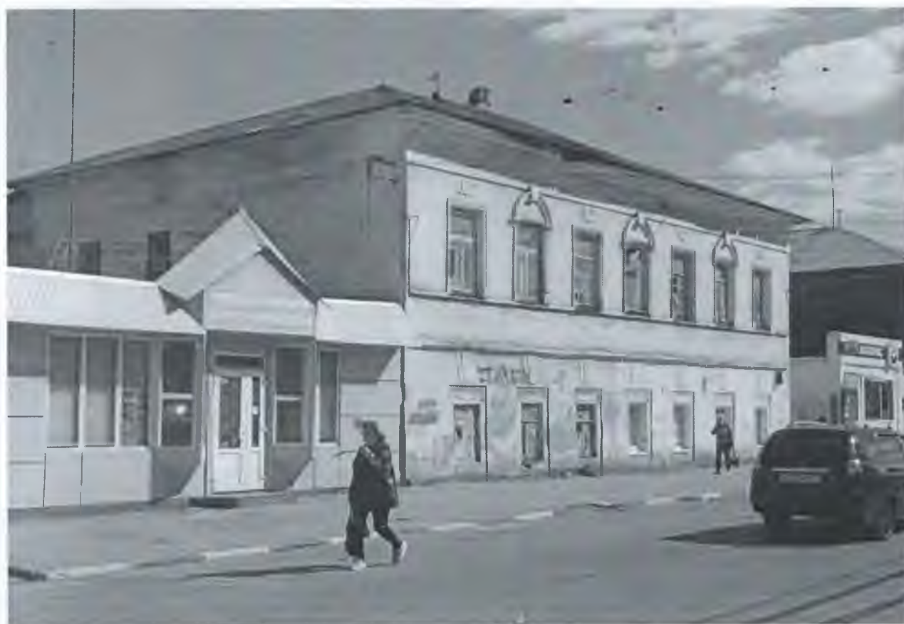
Фото 3. Вид с северо-запада.