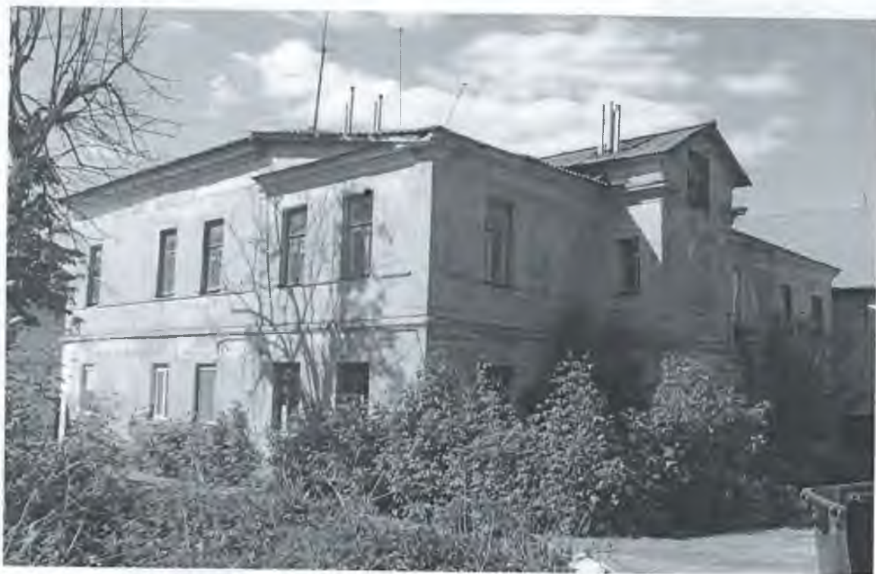
Фото 4. Вид с юго-востока.