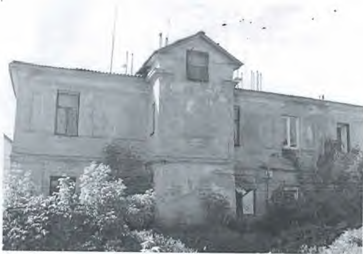
Фото 5. Восточный фасад.